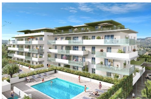
Façades des bâtiments 1 et 2 - côté jardin intérieur