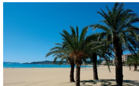
Plage du Lavandou