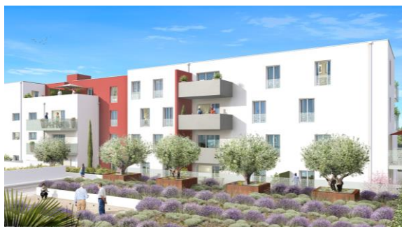
Façade du bâtiment 4 - côté jardin intérieur